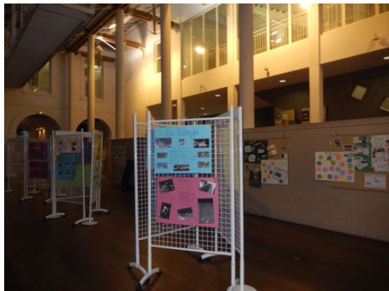
Exposition dans le hall