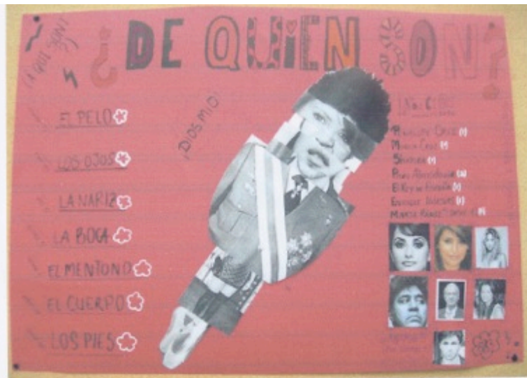
La journée du 26 septembre 2011 commencera en musique et chansons sous la direction de M. Vuillet, professeur de musique .Auparavant , les élèves passeront par le hall où une exposition leur fera découvrir divers lieux, personnes et